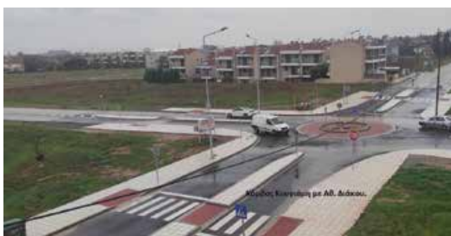
Ο κόμβος στη διασταύρωση με την Αθ. Διάκου.