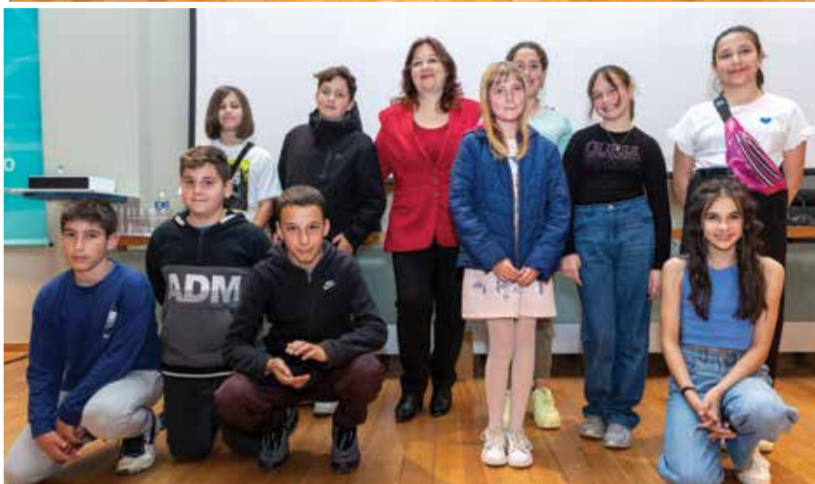
Βραβεία σε μαθητές και μαθήτριες που διακρίθηκαν για τις δεξιότητές τους