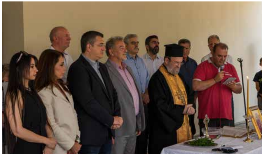
Θ. Παπαδόπουλος, Απ. Τζιτζικώστας, Β. Πατουλίδου κατά την τελετή των εγκαινίων.

Τ α επίσημα εγκαινία του 5ου δημοτικού σχολείου Θέρμης, στο Τριάδι πραγματοποιήσαν στις 9 Ιουνίου ο περιφερειάρχης Κεντρικής Μακεδονίας Απόστολος Τζιτζικώστας με τον δήμαρχο Θέρμης Θεόδωρο Παπαδόπουλο. Το σχολείο βρίσκεται στην επέκταση του οικισμού Τριαδίου, επί της οδού Αγιορειτών Πατέρων. Πρόκειται για μια υπεσύγχρονη σχολική μονάδα, δυναμικότητας 225 παιδιών και προϋπολογισμού 2.540.000 ευρώ, η κατασκευή της οποίας χρηματοδοτήθηκε από ευρωπαϊκούς πόρους της Περιφέρειας Κεντρικής Μακεδονίας.