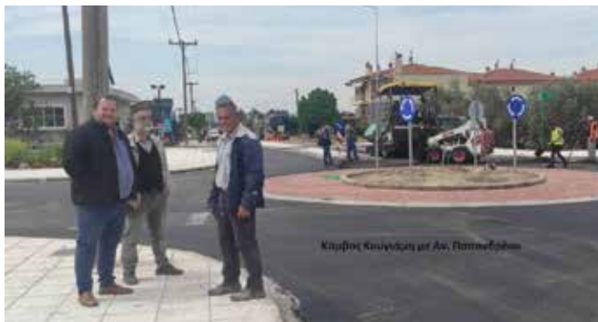
Ο κόμβος στη διασταύρωση με την Αν. Παπανδρέου.

"Η ολοκλήρωση των δύο κόμβων, μαζί με τον ήδη υπάρχοντα στη διασταύρωση της Απ. Κουγιάμη με την Παναγή Τσαλδάρη έχουν στόχο να βελτιώσουν τις συνθήκες οδικής ασφάλειας, μέσω του περιορισμού της ταχύτητας των οχημάτων. Παρά το