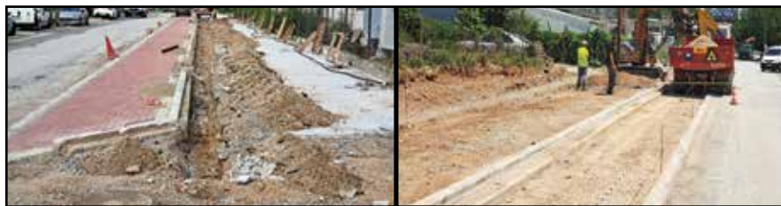
Οι εργασίες ξεκίνησαν τον Απρίλιο.

οι διαμορφωμένες συνθήκες (πλάτος πεζοδρομίου, δένδρα), ράμπες Α.Μ.Ε.Α., διαμόρφωση θέσεων κάδων απορριμμάτων, κατασκευή τοιχίου αντιστήριξης εκεί που θα χρειαστεί. Προβλέπεται επίσης ανάπλαση των ήδη υπάρχοντων θέσεων πάρκινγκ επί της οδού Μανδρίτσα και η κατασκευή νέων θέσεων πάρκινγκ αυτοκινήτων επί της μιας πλευράς της οδού Μεγάλου Αλεξάνδρου όπου θα γίνουν εκσκαφές, επίστρωση των σημείων αυτών με κυβόλιθους και αντικατάσταση των κρασπέδων. Την περιοχή εκτέλεσης των εργασιών επιβέβησε ο δήμαρχος Θέρμης Θεόδωρος Παπαδόπουλος,