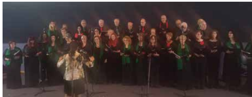
ΣΤΟ ΚΕΝΤΡΟ ΔΙΑΔΟΣΗΣ ΕΠΙΣΤΗΜΩΝ ΚΑΙ ΜΟΥΣΕΙΟ ΤΕΧΝΟΛΟΓΙΑΣ

Στην εκδήλωση παρευρέθηκε ο σεβασμιότατος Μητροπολίτης Κεφαλονιάς κ.κ. Δημήτριος, καθώς και πλήθος κόσμου.