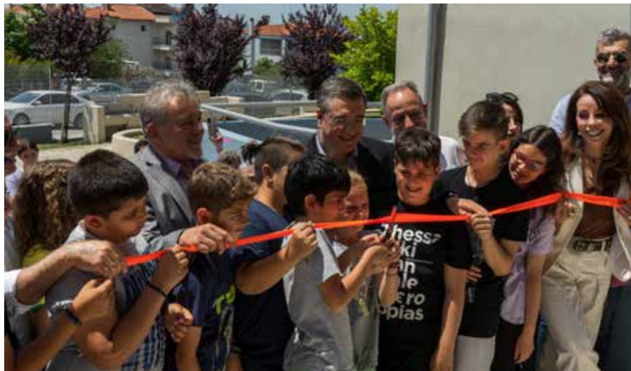
Τα παιδιά του σχολείου κόβουν την κορδέλα των εγκαινίων.