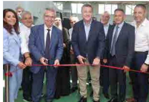
Από τα εγκαινία του κλειστού γυμναστηρίου.