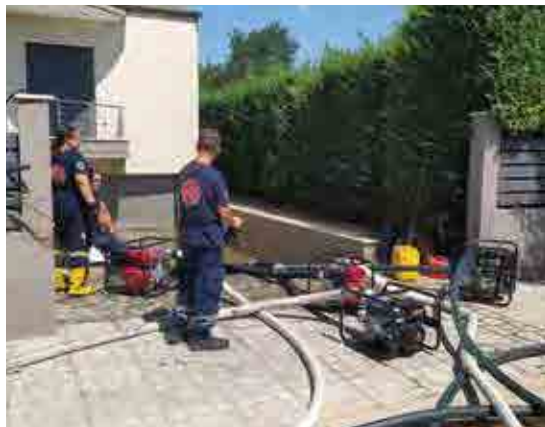
Με τέσσερα ειδικά πυροσβεστικά οχήματα οι εθελοντές βοήθησαν στην απάντληση των υδάτων.

Παράλληλα ο δήμος Θέρμης, το Τμήμα Πολιτικής Προστασίας καθώς και οι εθελοντικές ομάδες Θέρμης και Μίκρας, επί δέκα ημέρες πραγματοποίησαν συλλογή ανθρωπιστικής βοήθειας για τους πληγέντες της Θεσσαλίας. Εκατοντάδες ήταν οι κάτοικοι των κοινοτήτων του δήμου που ανταποκρίθηκαν στην πρόσκληση για την προσφορά ειδών πρώτης ανάγκης. Έτσι, σε διάστημα λίγων ημερών συγκεντρώθηκε ανθρωπιστική βοήθεια περίπου τριάντα τόνων η οποία την Παρασκευή 22 Σεπτεμβρίου εστάλη στις πληγείσες περιοχές με τέσσερα φορτηγά οχήματα, με είδη πρώτης ανάγκης όπως κλινοσκεπάσματα, καθαριστικά, απολυμαντικά, ξηρά τροφή κ.ο.κ.