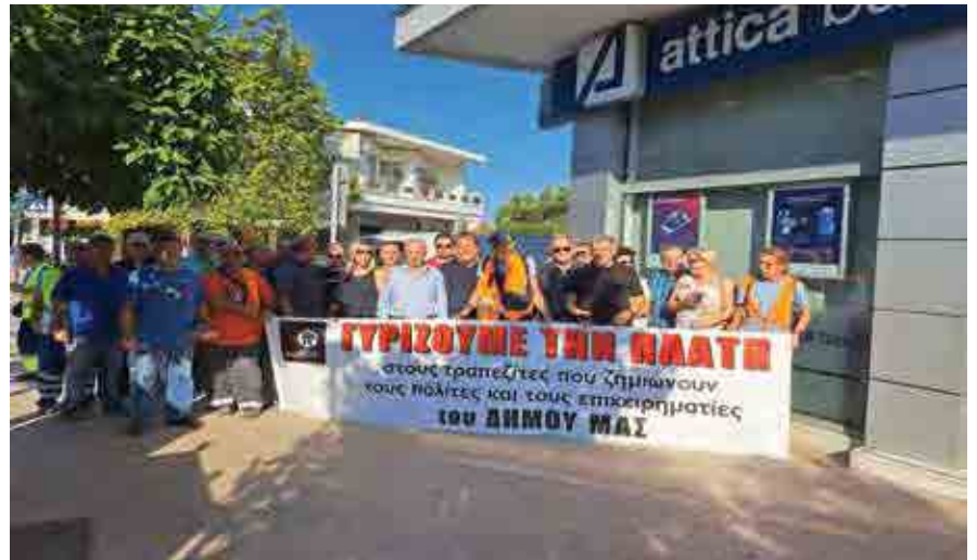
Από την παράσταση διαμαρτυρίας μπροστά στην τράπεζα Αττικής στη Θέρμη.

Π αράσταση διαμαρτυρίας μπροστά στο υποκατάστημα της Τράπεζας Αττικής στη Θέρμη, πραγματοποίησε το πρωί της Δευτέρας 31 Ιουλίου ο Δήμος Θέρμης, μαζί με επαγγελματίες και επιχειρηματίες της περιοχής. Η διαμαρτυρία αφορούσε την αιφνιδιαστική και ακατανόητη απόφαση της διοίκησης της Τράπεζας να προχωρήσει στο κλείσιμο του υποκαταστήματος το οποίο λειτουργεί εδώ και πολλά χρόνια στην έδρα του Δήμου Θέρμης.