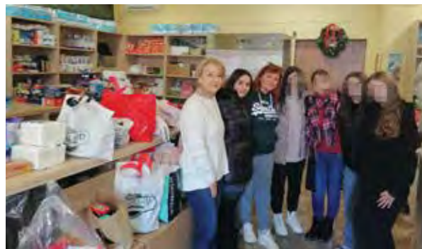
Παιδιά από το ΓΕΛ Μίκρας στο Κοινωνικό Παντοπωλείο.