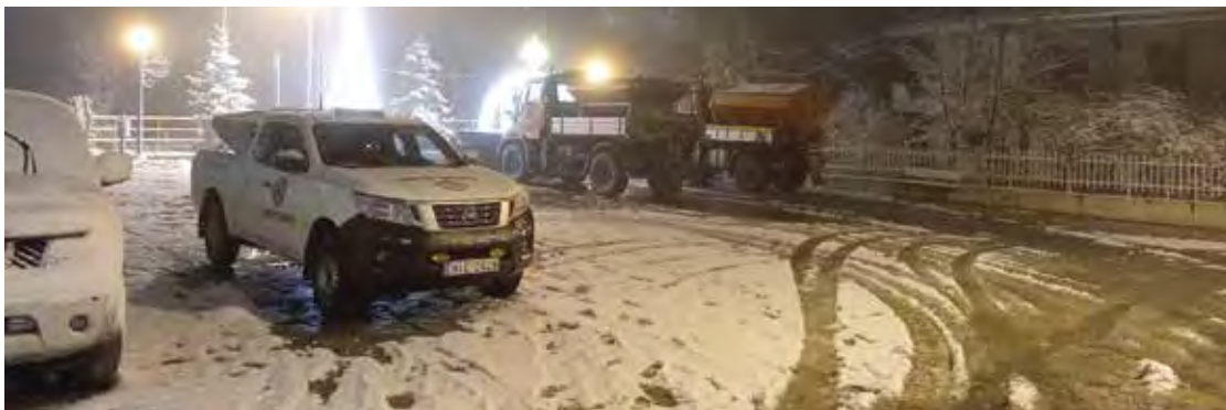
Πολιτική Προστασία και εθελοντές σε ετοιμότητα.

Σ τα λευκά ντύθηκαν τα ορεινά του δήμου Θέρμης στη διάρκεια των δύο χιονοπτώσεων που σημειώθηκαν μέσα στον Ιανουάριο και συγκεκριμένα στις 9 και 20 του μήνα. Περισσότερο χιόνι έπεσε στους ορεινούς οικισμούς, στο Λιβάδι, την Περιστερά, το Μονοπήγαδο τον Άγιο Αντώνιο καθώς και στην Καρδιά. Για την αντιμετώπιση των επιπτώσεων από τις χιονοπτώσεις ο μηχανισμός της Πολιτικής Προστασίας του δήμου Θέρμης με συνολικά επτά υπαλλήλους καθώς και τέσσερα εκχιονιστικά μηχανήματα και ένα μηχάνημα JCB, παρέμβαιναν διαρκώς, καθ' όλη τη διάρκεια των καιρικών φαινομένων, σε όλο το ορεινό οδικό δίκτυο, το οποίο παρέμεινε ανοιχτό και κατά τη διάρκεια της νύχτας.