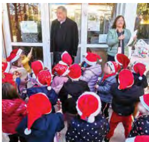
Κάλαντα από τα παιδικά του 4 ου νηπιαγωγείου Θέρμης.