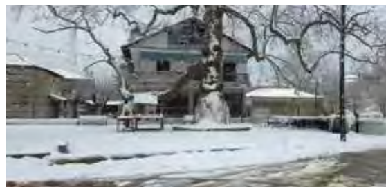
Η χιονισμένη πλατεία στο Λιβάδι.