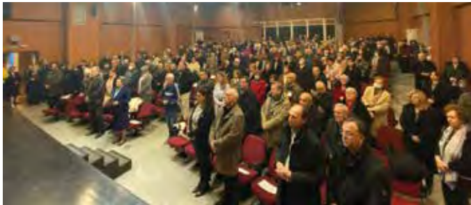
Γέμισε ασφυκτικά το θέατρο του Πολιτιστικού Κέντρου της Θέρμης.