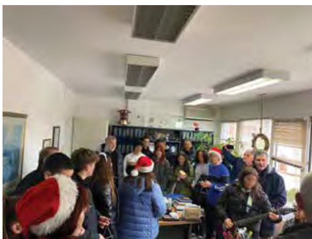
Κάλαντα από τα παιδιά του 1 ου λυκείου Θέρμης.