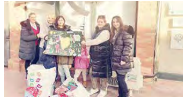
Δασκάλες και παιδιά του 2 ου νηπιαγωγείου Θέρμης προσέφεραν επίσης παιχνίδια.