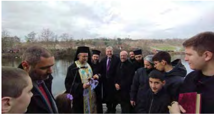
Από την εξέδρα στο Φράγμα της Θέρμης.

Μ ε τη δέουσα κατάνυξη και λαμπρότητα εορτάστηκαν τα Θεοφάνεια στο δήμο Θέρμης. Νωρίς το πρωί του Σαββάτου 6 Ιανουαρίου τελέσθηκε Πανηγυρική Θεία Λειτουργία στον Ιερό Ναό Αγίου Νικολάου Θέρμης και ακολούθησε ο «Μέγας Αγιασμός» των Θεοφανείων, παρουσία του δημάρχου Θέρμης Θεόδωρου Παπαδόπουλου και εκατοντάδων πιστών. Η τελετή του Αγιασμού των υδάτων στη λίμνη, στο Φράγμα της Θέρμης, έγινε λίγο μετά τις 12 το μεσημέρι, με την πολύτιμη συνδρομή και φέτος των Εθελοντών Πολιτικής Προστασίας Θέρμης. Ο δήμαρχος Θέρμης στο μήνυμά του τόνισε πως «τα Άγια Θεοφάνεια είναι μια από τις λαμπρότερες γιορτές της Ορθοδοξίας και αποτελεί την αφετηρία μιας προσπάθειας όλων μας, να εργαστούμε για ένα καλύτερο μέλλον. Είναι η ημέρα που συμβολίζει την κάθαρση και την πνευματική αναγέννηση και δίνει σε όλο τον κόσμο την ελπίδα και τη δύναμη να προχωρήσουμε με σταθερά βήματα στην προσπάθεια ανάπτυξης και εξέλιξης του τόπου μας έχοντας παράλληλα ως 'πυξίδα' την ειρήνη, την αγάπη και την αλληλεγγύη για τον διπλανό μας. Ας φωτίσουμε την καθημερινότητά μας με αισιοδοξία, ελπίδα και σιγουριά για το αύριο του τόπου και των παιδιών μας. Χρόνια πολλά σε όλους και του χρόνου με υγεία». Στον Αγιασμό των υδάτων στο Φράγμα Θέρμης παραβρέθηκε και ο υφυπουργός Υγείας Δημήτρης Βαρτζόπουλος.