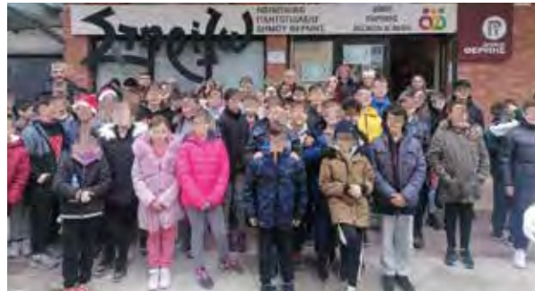
Παιδιά του 1 ου δημοτικού σχολείου Θέρμης προσέφεραν παιχνίδια.

Παράλληλα στο ανοιχτό κάλεσμα του Κοινωνικού Παντοπωλείου για προσφορά αγάπης τις ημέρες των εορτών ανταποκρίθηκαν σχολεία καθώς και Σύλλογοι και συγκεκριμένα: το 1ο δημοτικό σχολείο Θέρμης και το 2ο νηπιαγωγείο Θέρμης που πρόσφεραν παιχνίδια, μαθητές από το 1ο και το 2ο λύκειο Θέρμης και το ΓΕΛ Μίκρας, προσέφεραν τρόφιμα, ο Ι.Ν. Αγίου Γεωργίου Κ. Σχολαρίου παρέδωσε στο Κοινωνικό Παντοπωλείο παιχνίδια και η Κονδυλάκης FIGHT CLUB Θερμαϊκού έδωσε τρόφιμα.