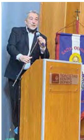
Ο δήμαρχος Θ. Παπαδόπουλος.