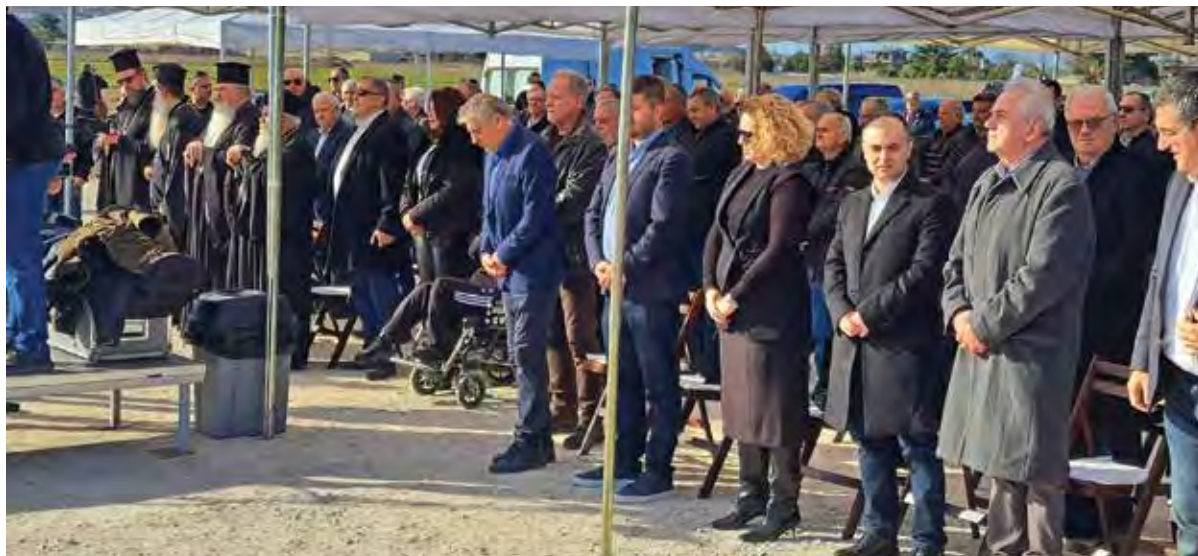
Από την τελετή αγιασμού

Μ ε τον αγιασμό ο οποίος τελέστηκε στις 19 Ιανουαρίου 2024 και την τοποθέτηση του θεμέλιου λίθου, ξεκίνησε και επίσημα η κατασκευή του νέου υπερσύγχρονου αθλητικού κέντρου της ΠΑΕ ΠΑΟΚ. Πρόκειται για μία έκταση 150 στρεμμάτων η οποία βρίσκεται στην 8η οδό της Κοινότητας Ταγαράδων του Δήμου Θέρμης. Η επένδυση της αγοράς των εκτάσεων από πλευράς του προέδρου και μεγαλομετόχου του ΠΑΟΚ Ιβάν Σαββίδη έφτασε στα 3 εκατ. ευρώ και ο σχεδιασμός προβλέπει δημιουργία υπερσύγχρονων αθλητικών εγκαταστάσεων οι οποίες θα καλύψουν τις ανάγκες όλων των τμημάτων του ΠΑΟΚ. Τον αγιασμό τέλεσε ο μητροπολίτης Κασσανδρείας κ. Νικόδημος ενώ παρέστησαν και οι μητροπολίτες Θεσσαλονίκης κ. Φιλόθεος, Νεαπόλεως Σταυρουπόλεως κ. Βαρνάβας και Φθιώτιδας κ. Συμεών.