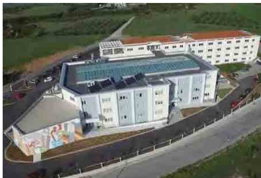
Οι εγκαταστάσεις της ΒΕΤΑ βρίσκονται στο Κάτω Σχολάρι.

Πώς γεννήθηκε και αναπτύχθηκε όμως η «ΒΕΤΑ CAE Systems»; Όλα ξεκίνησαν από το κοινό όραμα μίας ομάδας μηχανικών του ΑΠΘ, ενός καθηγητή,