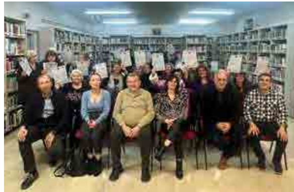
Οι επιτυχόντες της Θέρμης