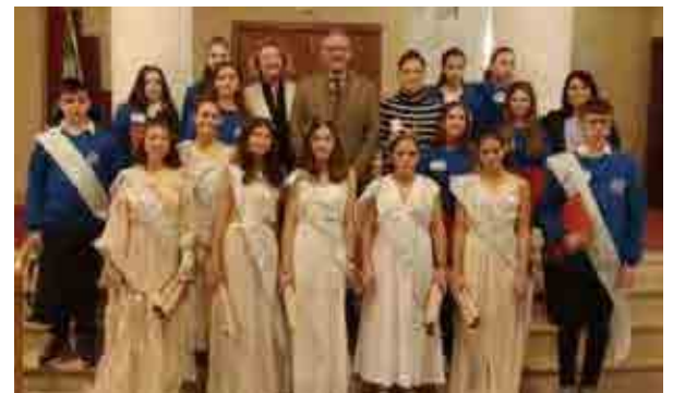
Οι 15 μαθητές και μαθήτριες του 3ου γυμνασίου Μίκρας που συμμετείχαν στο 8 ο ευρωπαϊκό μαθητικό συνέδριο στη Ρώμη.

και τον έρωτα, λέγοντας χαρακτηριστικά, μεταξύ άλλων, ότι «κάποιοι ποιητές προτιμούσαν απλώς να γράφουν το Roma... ανάποδα... Αμογ».