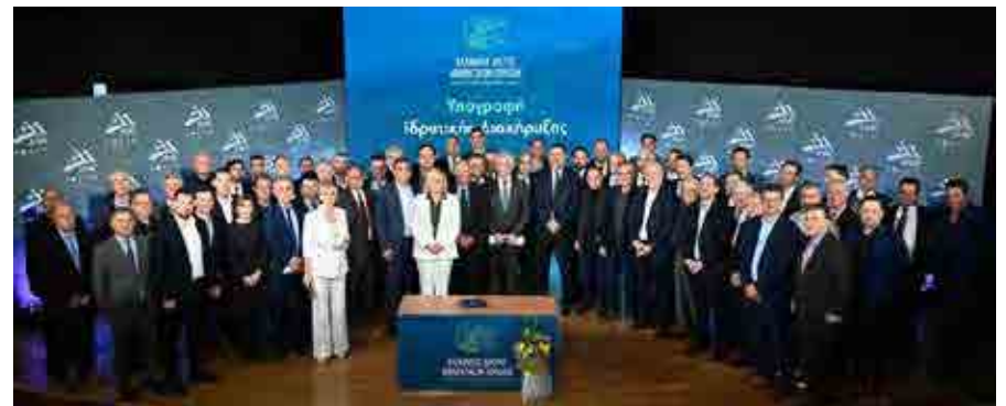
Ο δήμος Θέρμης είναι μεταξύ των 91 δήμων του Δικτύου Πόλεων για την Πολιτική Προστασία.

Δελφών, Άνδρου, Πρέβεζας, Νέας Ιωνίας, Αχαρνών, Πλατανιά, Νισύρου, Σουλίου, Λίμνης Πλαστήρα, Μεγαρέων, Σαρωνικού, Δομοκού, Σιθωνίας, Γορτυνίας, Μεγανησίου, Χίου, Μαρκοπούλου Μεσογαίας, Καμένων Βούρλων, Κορινθίων, Αργιθέας, Βόρειας Κέρκυρας, Αργινίου, Αγίου Νικολάου, Λουτρακίου-Περαχωράς Αγίων Θεοδώρων, Τεμπών, Λαμιέων, Καλαβρύτων, Μοσχάτου-Ταύρου, Φούρνων Κορσέων, Αρχαίας Ολυμπίας, Ξηρομέρου.