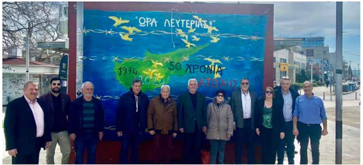
Το γιγαντοπανό με το μήνυμα «ΩΡΑ ΛΕΥΤΕΡΙΑΣ», κατασκεύασαν μαθητές του 1ου Ε.Ε.Ε.Κ με τη συμβολή των παιδιών του ΚΔΑΠ-ΜΕΑ «Αγκαλιά-ζω».

Ο δήμαρχος Θέρμης αφού συνεχάρη όλους όσους συνέβαλαν στη διοργάνωση της εκδήλωσης, καθώς και τους εκπαιδευτικούς του 1ου Ε.Ε.Ε.Κ. Θέρμης που είχαν την πρωτοβουλία για τη διεξαγωγή της, αλλά και όλων των σχολείων που έλαβαν μέρος, σημείωσε πως «πέρασαν ήδη πενήντα χρόνια, μισός αιώνας, από την εισβολή των Τούρκων στην Κύπρο και την κατοχή της Κερύνειας, της Αμμοχώστου και της Μόρφου. Πενήντα ολόκληρα χρόνια προσφυγιάς, πενήντα χρόνια διαίρεσης του νησιού σε βόρεια και νότια Κύπρο, πενήντα χρόνια αγνοουμένων, πενήντα χρόνια παραβίασης των ανθρωπίνων δικαιωμάτων. Δυστυχώς όμως η Διεθνής Κοινότητα δεν έχει καταφέρει έως σήμερα να δώσει οριστική λύση στο Κυπριακό ζήτημα, για ενότητα, κυριαρχία και εδαφική ακεραιότητα της νήσου εντός των διεθνώς αναγνωρισμένων συνόρων της. Εμείς, ως οφείλουμε θα συνεχίσουμε να στηρίζουμε ολόψυχα τον αγώνα των Κυπρίων αδελφών μας για τον τερματισμό