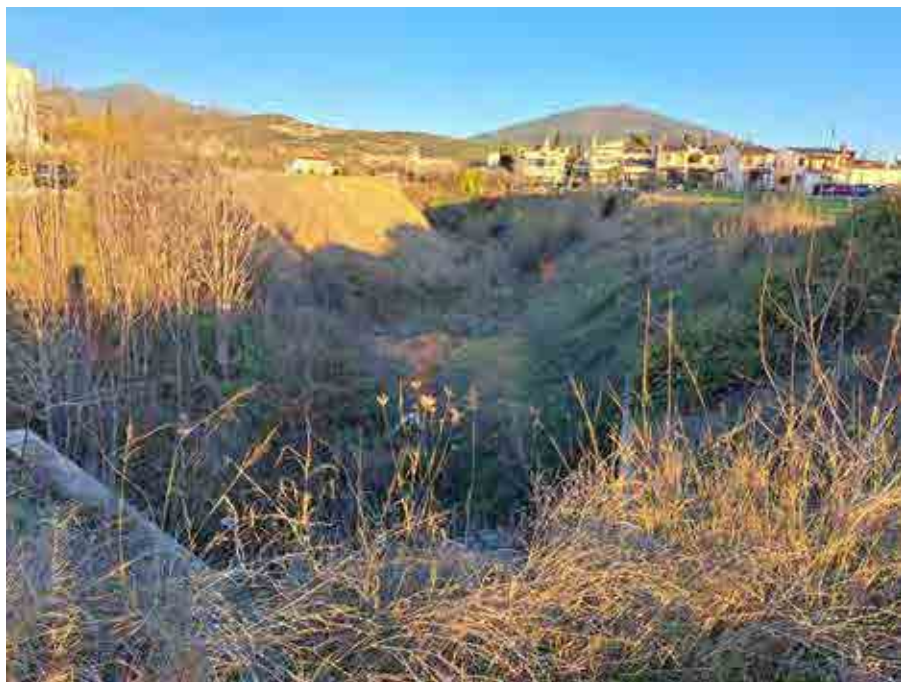
Οι εργασίες διευθέτησης του ρέματος αναμένεται να ξεκινήσουν σε περίπου δύο μήνες.

Μ έσα στο επόμενο δίμηνο αναμένεται να ξεκινήσουν οι εργασίες που αφορούν το έργο «Διευθέτηση ρέματος στο δημοτικό διαμέρισμα Θέρμης, από οικισμό Θέρμης ως γήπεδο Τριαδίου». Ο προϋπολογισμός του έργου ανέρχεται σε 7.924.410,20 ευρώ, πλέον ΦΠΑ 1.901.858,45 ευρώ και χρηματοδοτείται από το Πρόγραμμα Αγροτικής Ανάπτυξης 2014-2020 με συγχρηματοδότηση από το Ευρωπαϊκό Γεωργικό Ταμείο Αγροτικής Ανάπτυξης.