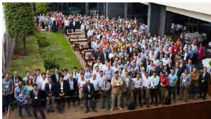
Η εταιρεία απασχολεί περί τους 450 εργαζόμενους.

έναν βοηθού καθηγητή και δύο φοιτητών. Μέχρι την ίδρυση της «ΒΕΤΑ CAE Systems ΑΕ» το 1999, αυτή η παρέα του Τμήματος Μηχανολόγων Μηχανικών του ΑΠΘ, συνάντησε πολλές δυσκολίες, δυσπιστία αλλά και απορρίψεις από ελληνικές αρχές και δομές.