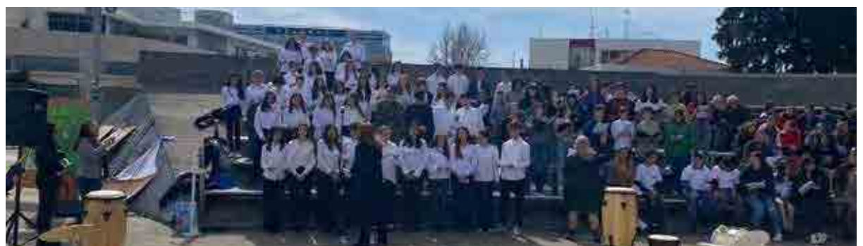
Η χορωδία των μαθητών

της τουρκικής κατοχής και την απελευθέρωση του βόρειου τμήματος του νησιού».