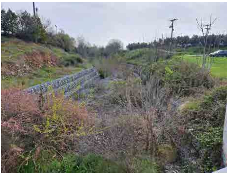
Ο προϋπολογισμός του έργου ανέρχεται σε περίπου 10 εκατ. ευρώ.

Στις 22 Δεκεμβρίου 2023 βγήκε στον αέρα από το Δασαρχείο Θεσσαλονίκης που είναι ο κύριος του έργου, η διακήρυξη του ανοιχτού ηλεκτρονικού διαγωνισμού. Καταληκτική ημερομηνία υποβολής των προσφορών είχε οριστεί η 25η Ιανουαρίου 2024. Κριτήριο για την ανάθεση της σύμβασης είναι η πλέον συμφέρουσα οικονομική προσφορά (βάσει της χαμηλότερης τιμής). Για τη συμμετοχή στο διαγωνισμό οι υποψήφιοι ανάδοχοι έπρεπε να καταθέσουν εγγυητική επιστολή ύψους 158.000 ευρώ. Ο χρόνος ισχύος των προσφορών είναι 13 μήνες μετά την ημέρα διεξαγωγής του διαγωνισμού ενώ η συνολική προθεσμία ολοκλήρωσης του έργου είναι 10 μήνες από την έναρξη των εργασιών. Στον διαγω-