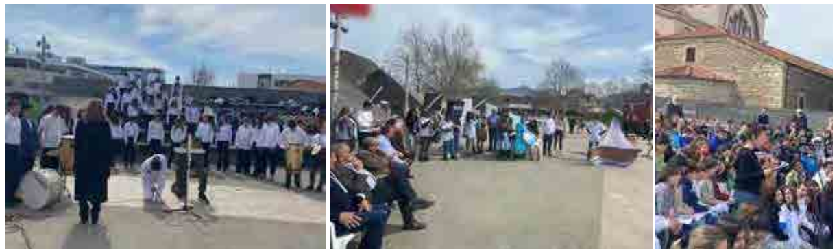
Από τα σκετς τα οποία παρουσίασαν οι μαθητές