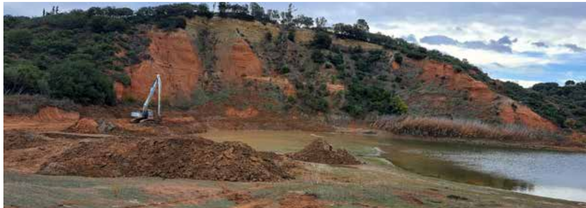
Από τον καθαρισμό της τεχνητής λίμνης Σχολαρίου

Επίσης θα συνταχθούν Σχέδιο και Φάκελος Ασφάλειας – Υγείας για τον βασικό μελετητή της Ειδικής Αρχιτεκτονικής μελέτης καθώς και Τεύχη Δημοπράτησης του έργου.