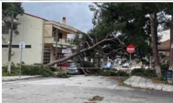
Από τους ισχυρούς ανέμους έπεσαν περίπου διακόσια δέντρα.

Όλο αυτό το διάστημα ο μηχανισμός Πολιτικής Προστασίας του Δήμου, με επικεφαλής τον δήμαρχο Θεόδωρο Παπαδόπουλο και τον αρμόδιο αντιδήμαρχο Κωνσταντίνο Κουγιουμτζή, με την πολύτιμη συνδρομή των εθελοντικών ομάδων Θέρμης και Μίκρας, συνεργείων της ΔΕΗ, αλλά και του προσωπικού του Δήμου, προσπάθησαν, από τις πρώτες πρωινές ώρες του Σαββάτου 30 Νοεμβρίου 2024 ως και την Τρίτη 3 Δεκεμβρίου να αποκαταστήσουν όλες τις ζημιές.