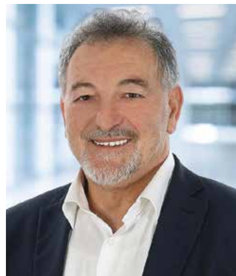
Ο ΔΗΜΑΡΧΟΣ ΘΕΡΜΗΣ

πλέον 639.760,94€. Η υπηρεσία για να καλύψει τη διαφορά ύψους 332.253,36€ (972.014,30–639.760,94), θα εντείνει την προσπάθεια είσπραξης παλαιών οφειλών και οριστικών ανείσπρακτων τελών που αποστέλλονται από τους παρόχους και θα συνεχίσει τους ελέγχους των τετραγωνικών μέτρων των ακινήτων προς κάλυψη όποιων περαιτέρω αναγκών προκύπτουν στα έσοδα. Σημειώνω δε, ότι εξακολουθούν να ισχύουν οι ευνοϊκές ρυθμίσεις της τιμολογιακής πολιτικής του Δήμου σε όλες τις άλλες κατηγορίες των συντελεστών, καθώς και οι απαλλαγές και οι εκπτώσεις για ειδικές κατηγορίες συμπολιτών μας”.