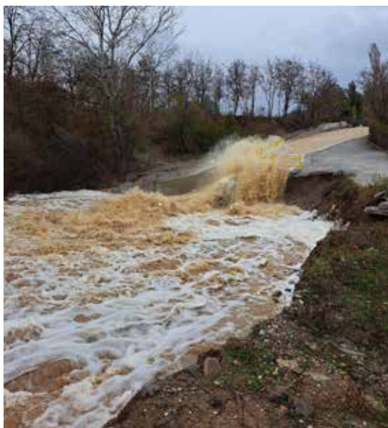
Από την έντονη βροχή υπερχειλίσε το φράγμα της Θέρμης.